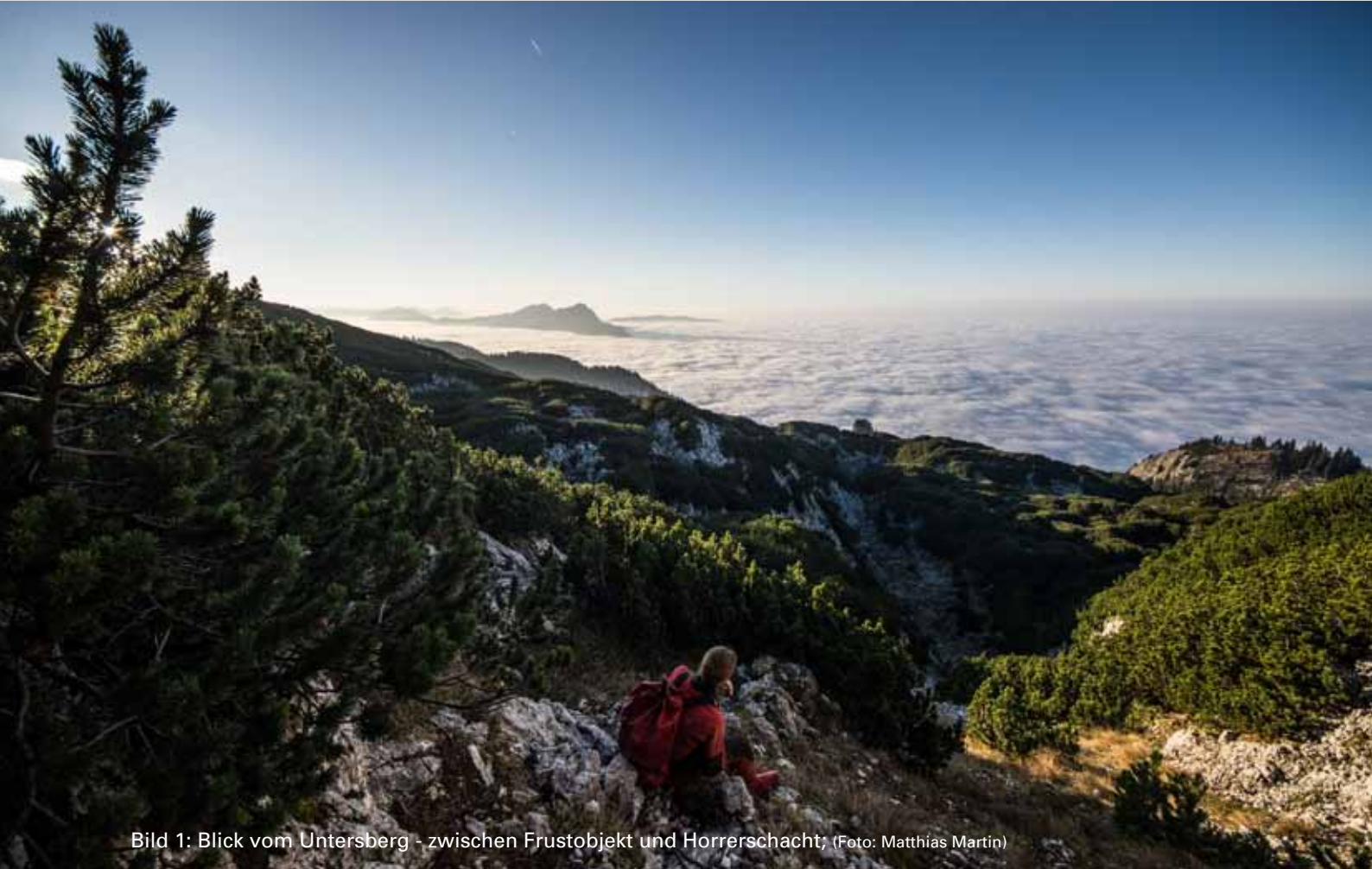
Bild 1: Blick vom Untersberg - zwischen Frustobjekt und Horrerschacht; (Foto: Matthias Martin)