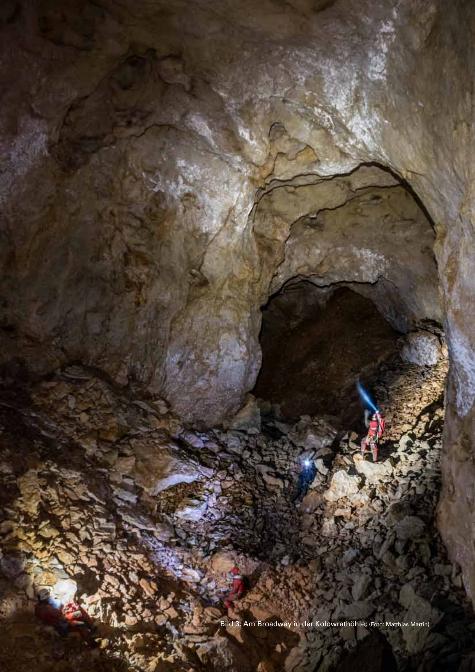
Bild 3: Am Broadway in der Kolowrathöhle