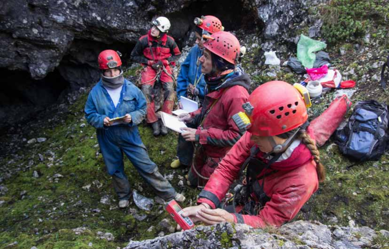
Bild 5: Vermessungsworkshop am Eingang des Hirscheneiskellers; (Foto: Matthias Martin)

20 Meter tief kullerte und immer wieder an der Wand aufschlug. Danach war es sehr lange still, bevor der Stein in großer Tiefe aufschlug und dabei ein sehr dumpfes und hallendes „PLONG“ erzeugte. Die Begeisterung war riesig und wir kamen aus dem Staunen kaum heraus. Wir waren nun überzeugt davon, dass der Horrer-Schacht hinunter zum Biwak führt. Deshalb waren wir auch nochmals etwa eine Minute lang mucksmäuschenstill, um zu hören, ob der Stein in 1000 m Tiefe noch ein klapperndes Geräusch erzeugte, wenn er auf Georgs Kochgeschirr im Biwak aufschlagen würde. Obwohl kein Geräusch mehr zu hören war, war für uns klar, dass es nur noch eine Frage der Zeit ist, bis der Horrer-Schacht ein Teil der zukünftigen Kolowrat-Riesending-Großhöhle ist.