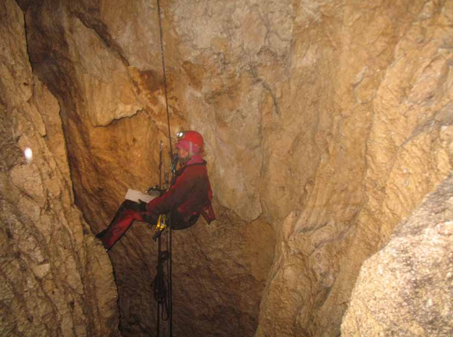
Bild 9: Silia schreibt das Vermessungsprotokoll im Horrerschacht

bruders, sondern auch über bisher ungekannte familiäre Zusammenhänge.