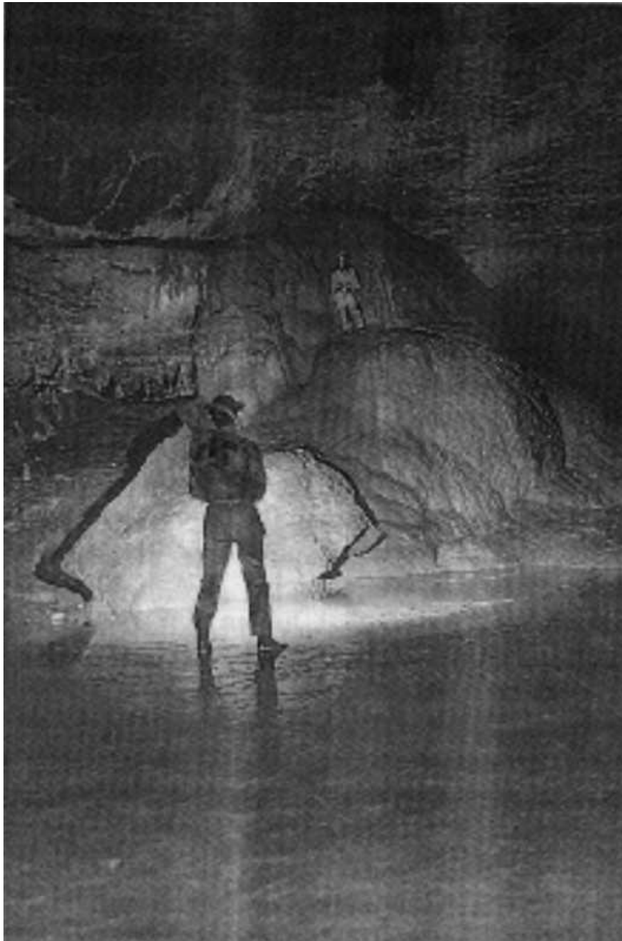
Bild 4: In der Grotte Gournier, Eingangsteil; Aufnahme: Stefan Mittelberg