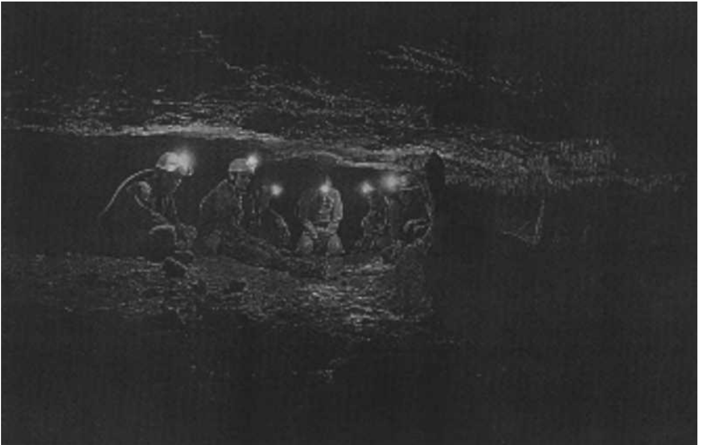
Bild 2: Im fossilen Teil des Gour Fumant

Wir machen uns also wieder auf den Rückweg und ein aufregendes Spiel beginnt: welches ist unser Seil? Was hat mich der entgegenkommende Franzose gefragt? Wo sind die anderen . . . und wo bin ich?