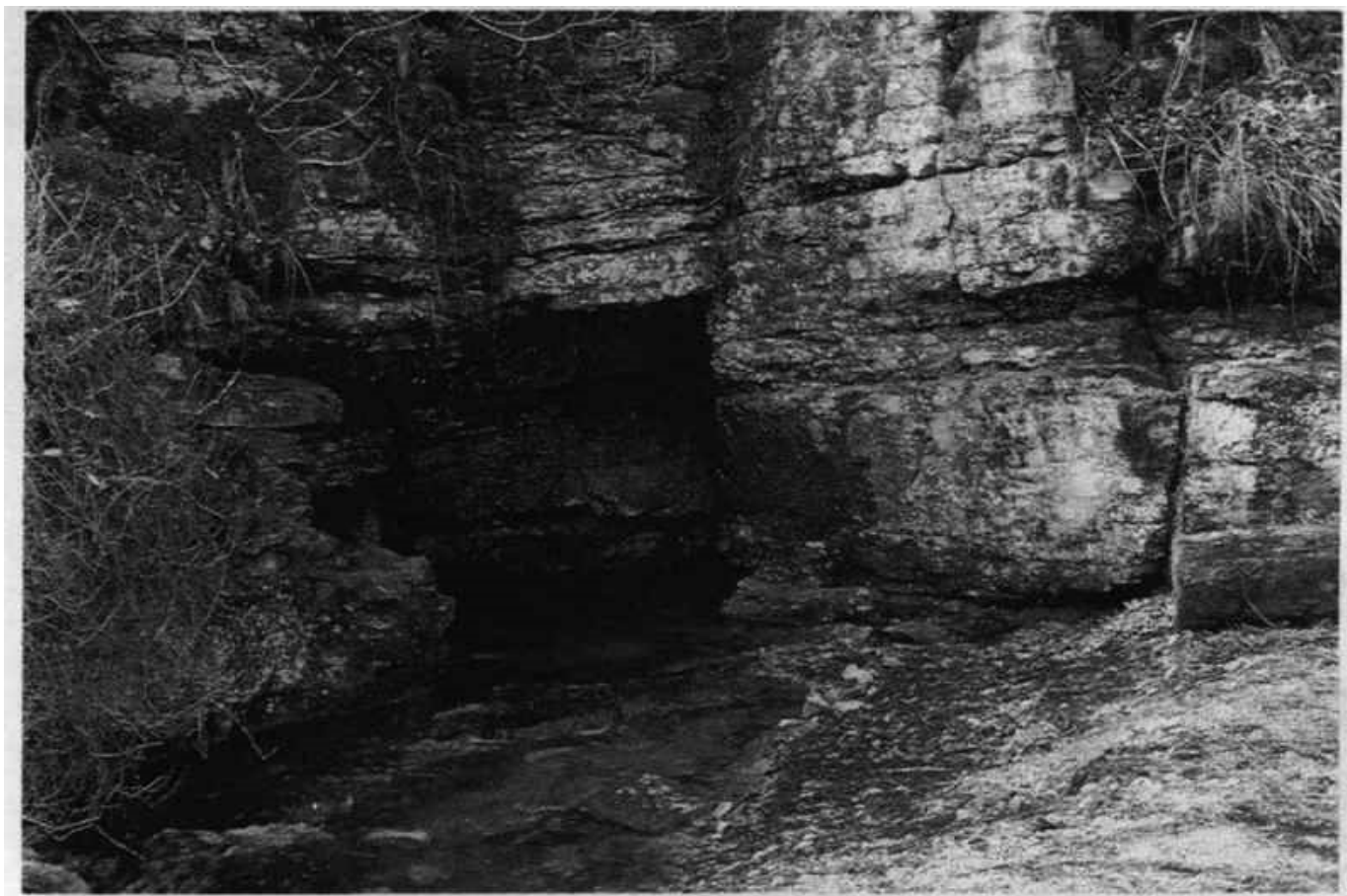
Abb. 1: Schmiechquelle

Bei einer kurzfristig angesetzten Pumpaktion am 21. Oktober 1989 wollten wir untersuchen, wie sich die Quelle bei extremem Niedrigwasserstand verhält und ob Wasserstand und Schüttung durch eine große Pumpleistung beeinflussbar sind. Außerdem sollte ein Taucher versuchen, in der bereits bekannten Kammer im Innern die Herkunft des Wassers zu erkunden und den Zulauf eventuell freiräumen.