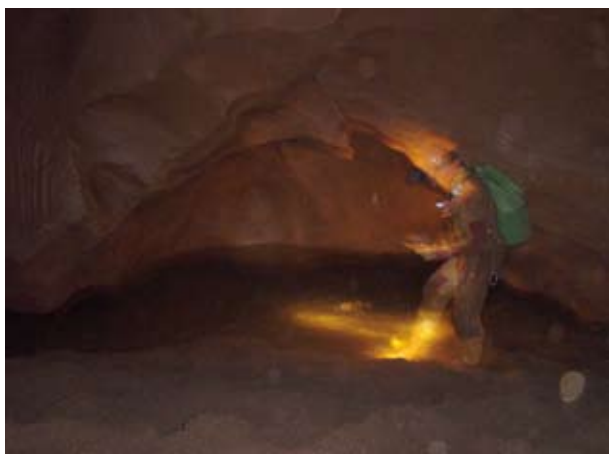
Arbeitsgemeinschaft Höhle und Karst Grabenstetten