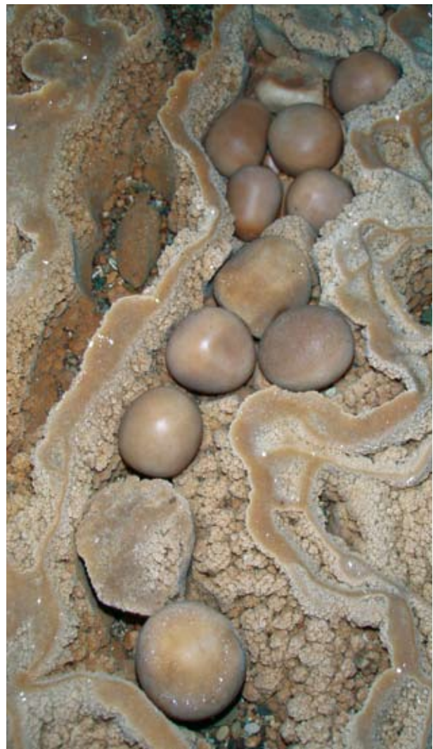
Arbeitsgemeinschaft Höhle und Karst Grabenstetten