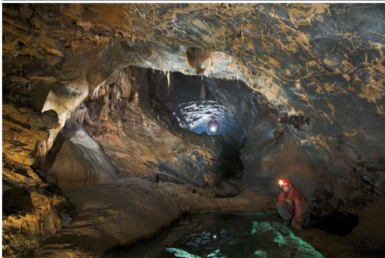
An einem Wassertopf