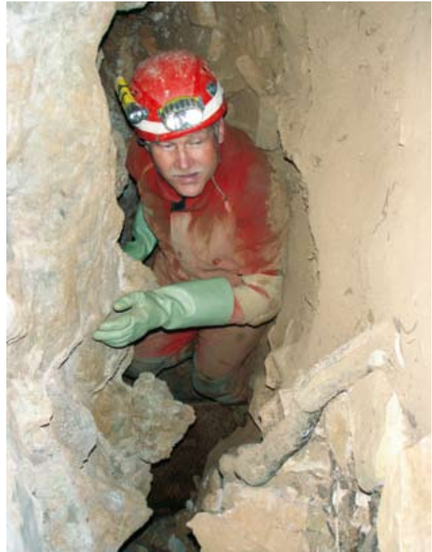
Bis morgen muss alles wieder trocken sein